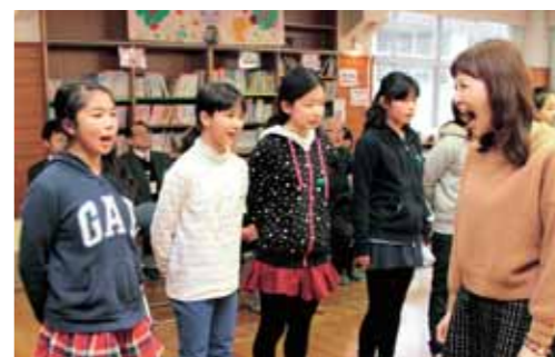
劇団四季の俳優から「母音法」について学ぶ桜丘小の児童

劇団四季ファミリーミュージカルに先立って、俳優による「美しい日本語の話し方教室」が、桜丘小学校と楠丘小学校の5年生を対象に行われました。講師の3人が腹式呼吸で母音をはっきりと発音する劇団四季独自の「母音法」を指導。児童らは指導に目を輝かせながら、母音を美しく話す練習を繰り返し、最後に合唱曲「友だちはいいもんだ」を声を合わせて歌いました。