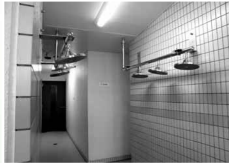
リニューアルした温水プールとシャワー室