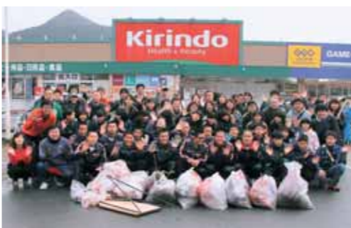
ボランティアおよそ100人による新人駅伝コースの清掃活動

第8回西脇多可新人駅伝競走大会を前に、市民などのボランティアおよそ100人がコース沿道などを清掃しました。全国から集まる出場選手の皆さんに「駅伝のまち西脇」を気持ち良く走ってもらおうと、市内の中高校生や家族連れなどが参加。4班に分かれ空き缶やゴミなどを拾いました。参加者は「選手の皆さんのため、心を込めて清掃した」と笑顔で話していました。