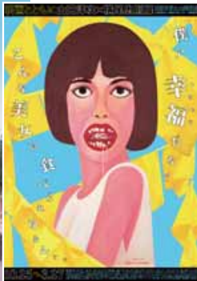
▲開催中の企画展ポスター