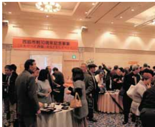
「こだわりの日本酒Bar in にしわき」の会場

市制10周年を記念して「日本のへそ西脇・おもてなしイベント」を、このわりの日本酒Bar in にしわき」を開催。西脇市産山田錦を使った日本酒や新グルメ・西脇ローストビーフを提供し、西脇市の食の魅力を提供しました。また、同イベントに先立って「山田錦生産者大会」も行われました。