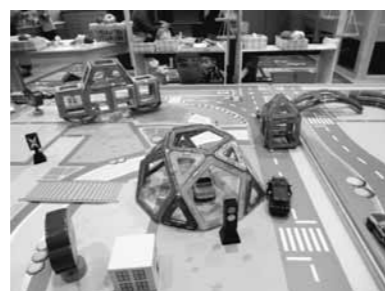
磁石のブロックをくっつけて遊ぶマグフォーマー

になりきって赤ちゃんのお世話ができます。ベビーカーに乗せてお散歩をしたり、お料理をする姿は大人の真似っこをしているようです。こどもプラザには、保育士・社会福祉士等を配置しています。「子育てでこんな時どうしたらいいの?」「誰かに話を聞いて欲しい」。そんな時はお気軽に声を掛けてください。遊びを通してお子さんの発達をお手伝いし、保護者と一緒に成長を見守って