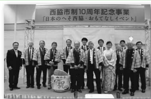
おもてなしイベントで西協市をPR

トラブル発生時の引越し業者の責任の有無等を決めており、解約・延期手数料は、引越し荷物の受取日の前日で10%以内、当日で20%以内です。また、荷物の破損、紛失については、荷物の引渡し日から3ヵ月以内に連絡しないと、事業者の責任は消滅しますので注意が必要です。