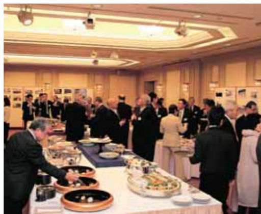
約70人が参加。ふるさとの話題で盛り上がる会場

第21回東京西脇多可の会総会・懇親会が開催されました。同会は関東圏周辺にお住まいの西脇市および多可町出身者などで構成される同郷会です。懇親会では、ふるさとの話題に花が咲き、会員同士の近況報告や新会員紹介、アトラクション、市歌の合唱など大いに盛り上がりました。