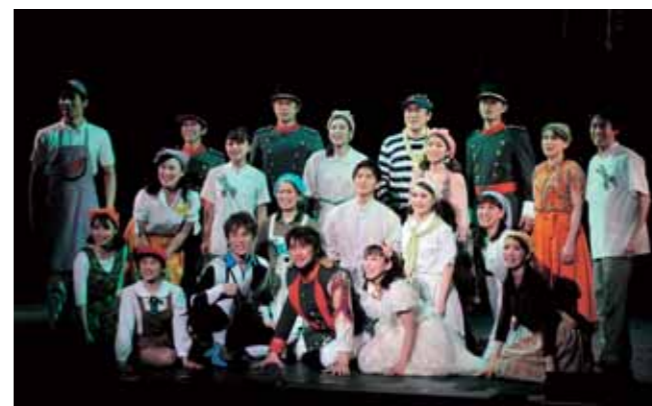
歌やダンスいっぱいの劇団四季の公演