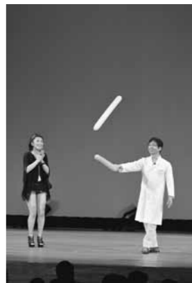
写真はイメージです。実際の内容と異なる場合があります。

■注意事項 ①先行発売は、市内在住の方からの申し込みに限ります。 ②1通のはがきで6枚まで申し込みできます。 ③座席の希望はできません。 ④10月22日(木)以降のキャンセルはできません。