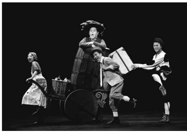
写真は前回公演より。

■料金 大人4,000円▽子ども(中学生以下)2,500円▽3歳未満の膝上鑑賞は無料・全席指定