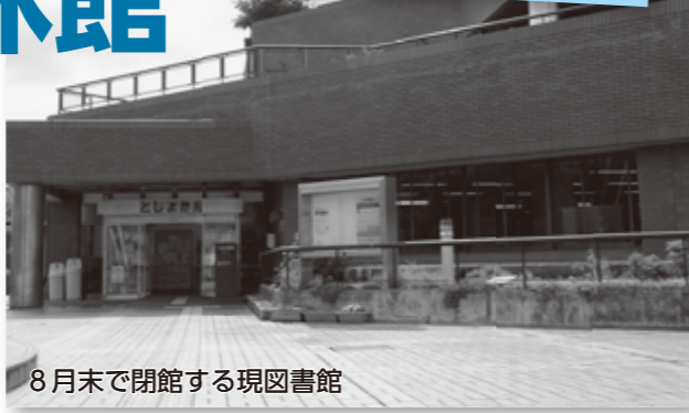
8月末で閉館する現図書館

西脇市図書館は、茜が丘複合施設「Miraie」内に 新しく開館する新図書館へ移転作業を行うため、8月 31日(月)を最後に閉館します。9月1日(火)から新 図書館がオープンするまでの間、臨時休館します。市 民の皆さんにはご不便をおかけしますが、ご理解いた だきますようお願いいたします。