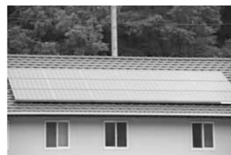
屋根の上に設置された太陽光パネル

平成27年6月1日から、予算の範囲内で受け付けます。交付申請書の提出は平成28年3月31日までとなります。