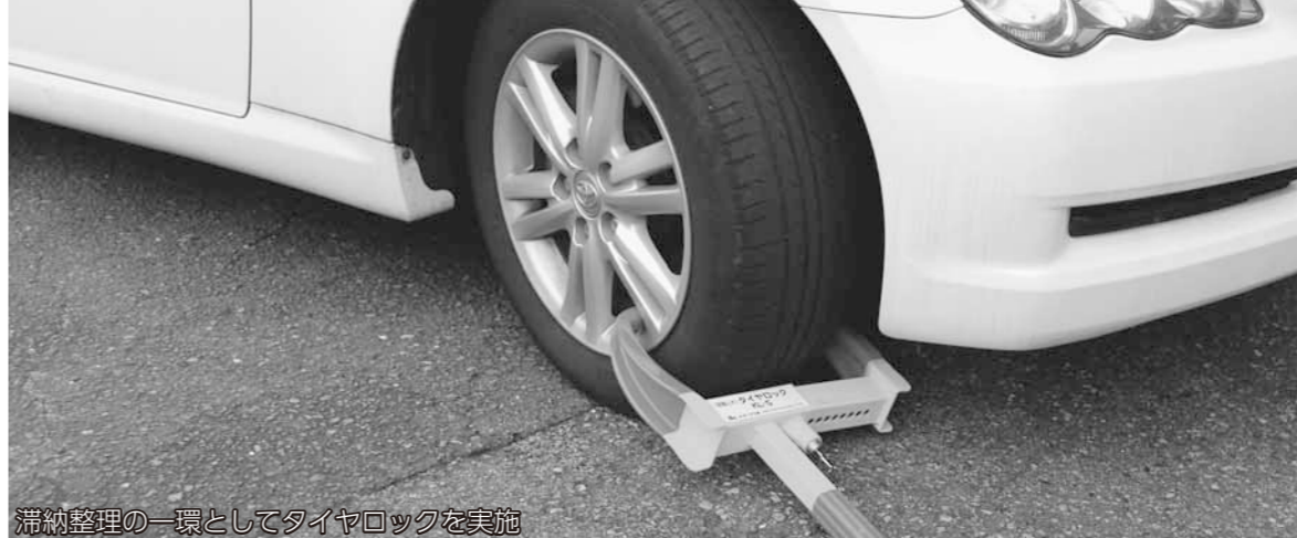
滞納整理の一環としてタイヤロックを実施

西脇市と兵庫県では、12月を「税の徴収強化月間」と位置付けて、税収の確保に取り組んでいます。 税は、福祉や教育、土木事業などの公共サービスを支えている大切な財源です。税の滞納は、善良な納税者との公平性を欠く行為であり、決して見逃すことはできません。不誠実な滞納者に対しては、滞納処分を実施します。 また、今年度も昨年度に引き続いて、兵庫県から「個人住民税等整理回収チーム」の派遣を受け、滞納整理の強化と職員の滞納整理技術の向上を図っています。