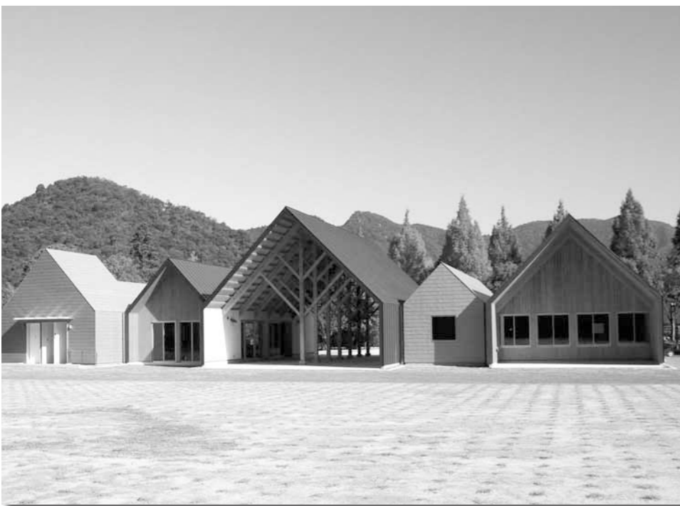
11月29日にオープンしたオートキャンプ場内の交流施設