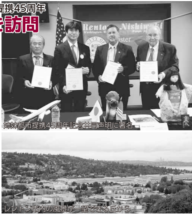
姉妹都市提携45周年記念共同声明に署名

また、ボーイング社の見学やシアトル市内の観光などをし、ホームステイなどを通じてレントン市民との絆を深めました。