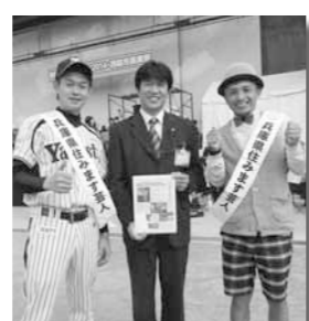
産業フェスタ・西脇市農業祭会場にて...

西脇市は自治体として初めて、公益財団法人新産業創造研究機構(通称NIRO・神戸市)と包括連携協定を締結しました。NIROは産学官連携による新技術の研究・開発などを行う大変有能な組織です。市が提供する研究の場や情報、NIROの技術的・学術的支援とのコラボで、地場産業の新たな展開や新産業創造、環境配慮型社会の実現を目指していきます。