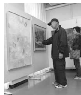
第62回西脇市美術展