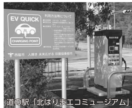
道の駅「北はりまエコミュージアム」