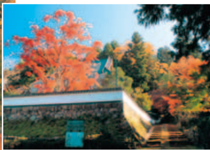
▲本堂へと続く参道