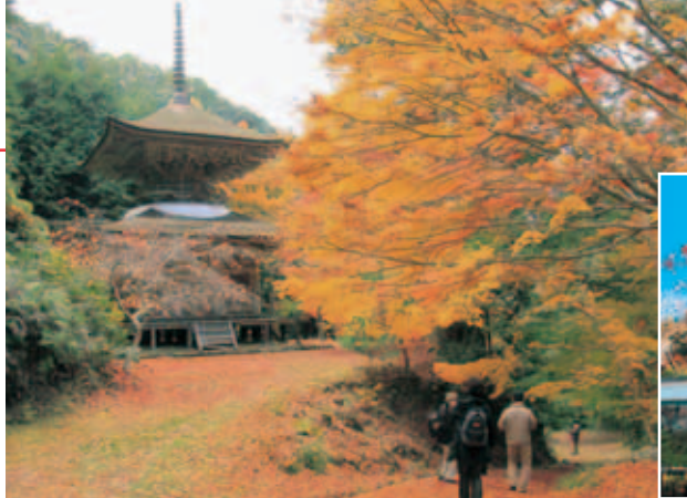
▲県重要文化財の多宝塔