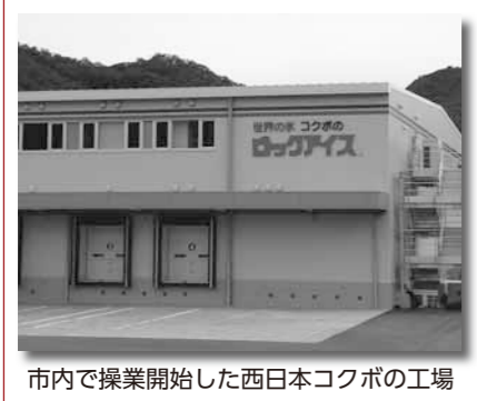
市内で操業開始した西日本コクボの工場

開運グッズ購入にお金を支払うと、次々といたずらに不安をあおられ、金運・開運上昇のための高額な祈とうを勧められたりして被害が拡大します。お金を多く支払うことで運が開けたり幸せになれるわけではありません。雑誌等を見て自ら業者に申し込んだ契約は、通信販売でクーリング・オフ制度の適用はありませんが、電話や会場で勧誘されて契約した祈とうサービスや商品などについては、クーリング・オフ等ができることがあります。困った時は一人で悩まず、すぐに消費生活センターにご相談ください。