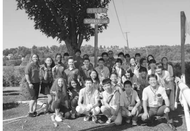
▲レントン市「西脇通り」を訪れ記念撮影

○初めは、不安だらけでしたが、言葉が通じなくても一緒に楽しむことができるということがわかりました。日本の良さも伝えることができました。 ○アメリカの文化に触れ、想像以上に楽しい滞在でした。また、アメリカにたくさん友達ができうれしかったです。 ○この十日間は、本当に充実していました。いろいろな人と触れ合う中で、コミュニケーションの大切さが改めて分かりました。 ○ホストファミリーがとてもフレンドリーに接してくれて少しずつ打ち解けました。自分の話す英語が通じた時はうれしかった。また、食文化の違いに大変驚きました。