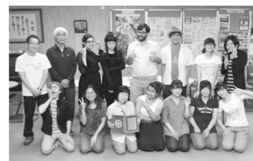
楽しい雰囲気です！

し役として、にほんごきょうしつの開催をはじめ、西脇市の姉妹都市であるアメリカ合衆国ワシントン州レントン市市民団の歓迎交流事業や、海外の人々とのふれあい交流、そして国際交流に関する広報活動などに取り組んでいます。協会では会員を募集中です。また、にほんごきょうしつの日本語指導ボランティアも募集しています。資格や経験は不問で、外国語ができなくても問題ありません。あなたも国境を越えた友人を作ってみませんか。