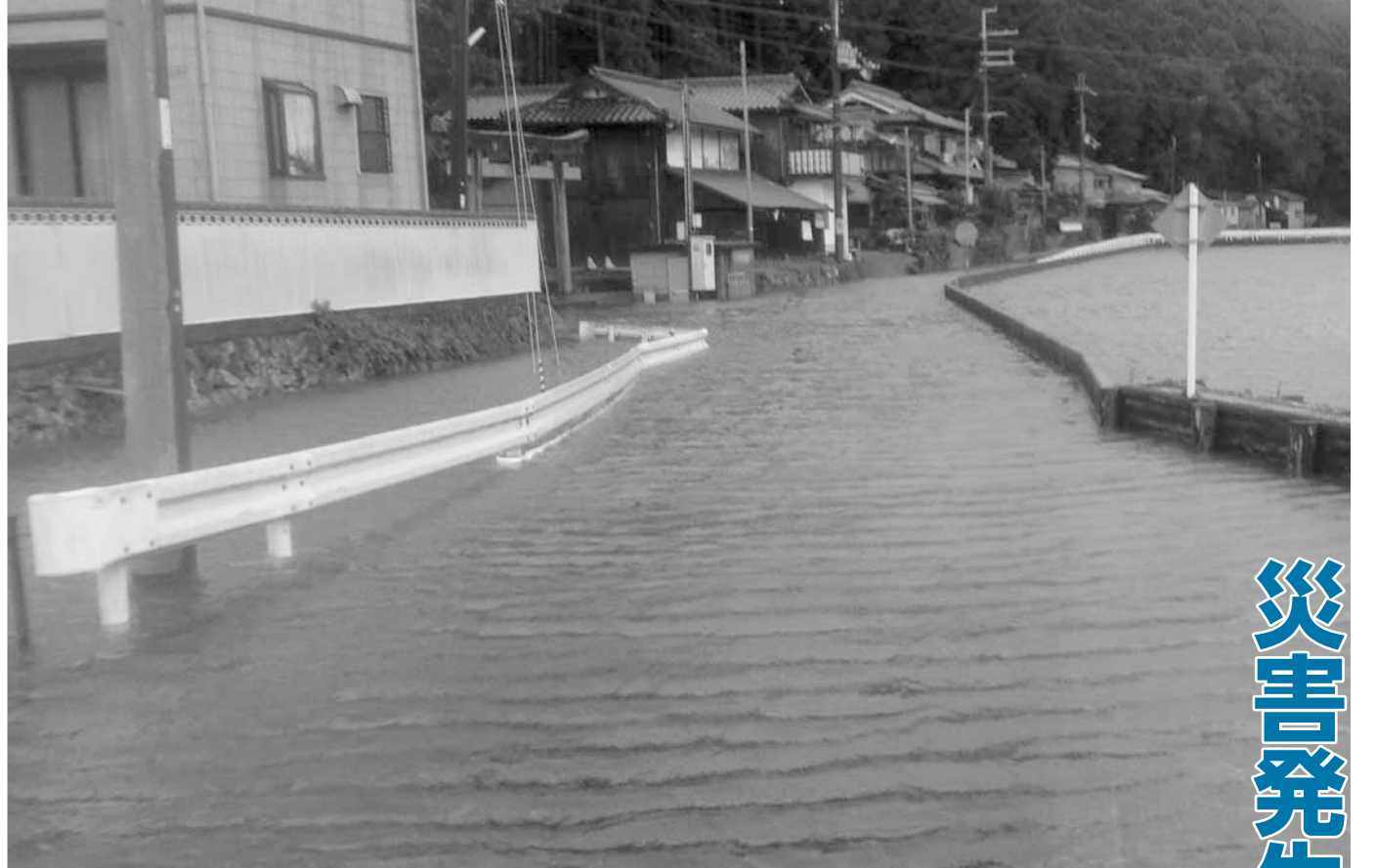
台風18号による黒田庄町大伏の浸水（平成25年9月）

災害が発生したとき、あなたは自分や愛する家族を守れますか？ 地震や台風、局地的集中豪雨などの災害はいつ発生するかわかりません。そのため、さまざまな立場で日ごろからの備えを十分にしておく必要があります。わたしたちにできる備えとは、どのようなものでしょうか。いざという時のために考えてみましょう。