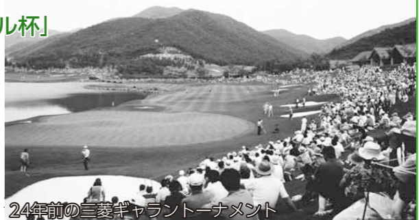
24年前の三菱ギャラントーナメント