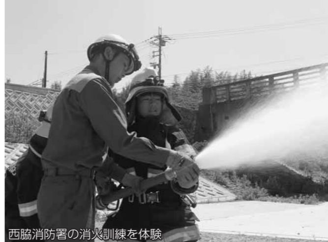
西脇消防署の消火訓練を体験