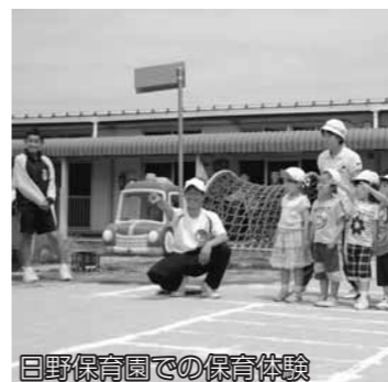
日野保育園での保育体験