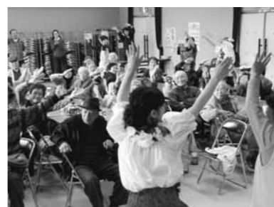
食事は楽しく地域社会とつながるよい機会になっています

11月6日 弁当を配達 1カ月に4回、調理ボランティアの方が作った弁当を、一人暮らしの高齢者に配達。呼び鈴になかなか出られないので心配しましたが、別室にいて聞こえなかったとのこと、胸をなで下ろしました。