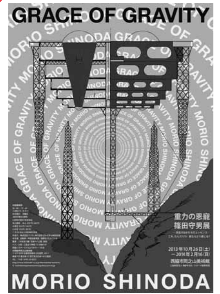
横尾忠則さんデザインのポスター

今年度西協市名誉市民の称号をお贈りした西協市出身の美術家・横尾忠則さんの企画展が下記のとおり開催されています。 会場/横尾忠則現代美術館 会期/9月28日(土)~平成26年1月5日(日) 開館時間/午前10時~午後6時(金・土曜日は午後8時。入館は閉館30分前まで) 休館日/12月2日(月)・9日(月)・16日(月)・24日(火)、12月30日~1月1日 観覧料金/一般600円、大学生450円、高校生・65歳以上300円、中学生以下無料 問合せ/横尾忠則現代美術館(☎078-855-5607)