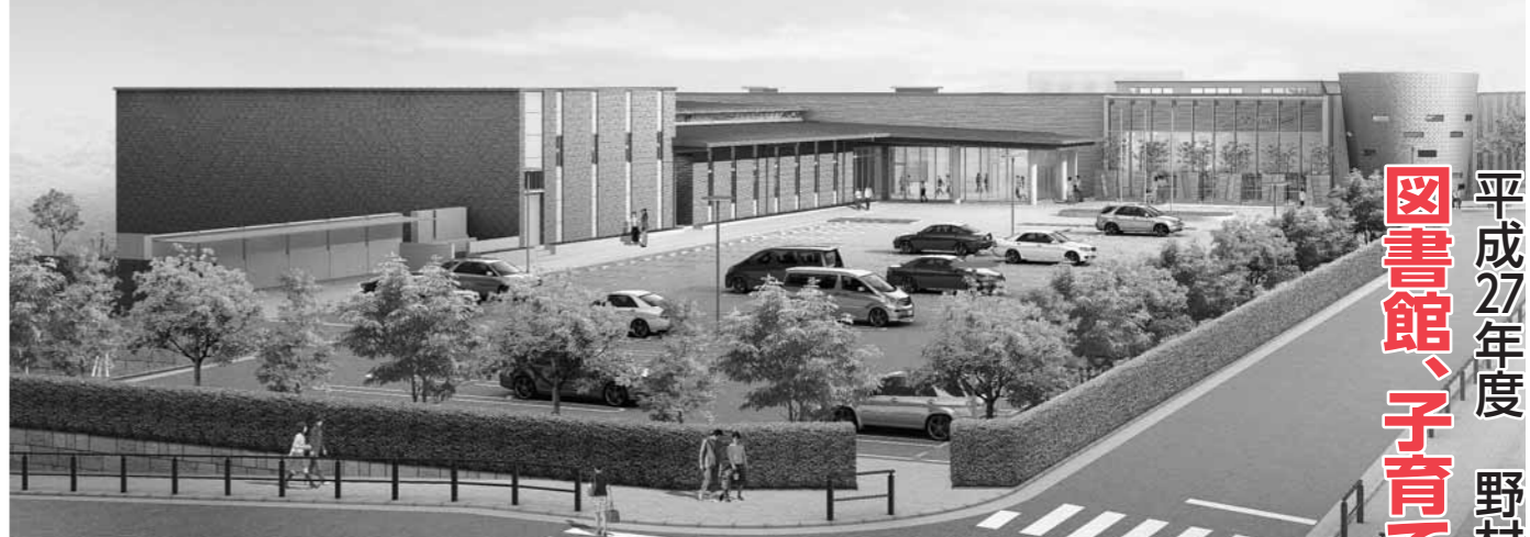
茜が丘複合施設完成イメージ