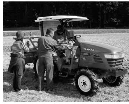
▲「農村ワークショップ」は体験講座。先生は地元の人たち

日時計の丘公園には年間約2万人が宿泊しています。キャンプだけでなくこの地域の魅力を伝えながら楽しさを提供していくことで、この地域をもっと元気にしていこうと活動を続ける「日時計の丘公園周辺地域活性化委員会」は、兵庫県ふるさと自立計画推進モデル事業に認定されています。