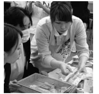
▲看護師新人研修の様子

それは、都会で就職して働いていた人たちが「地元に戻って、地元で働きたい」という思いから、さらに、親御さんからの「帰ってきて、西脇病院で働いてみたら」という声に添えて、当院に就職をしてくれる看護師がいることです。昨年度は、19名が就職をしてくれ、今、より良い看護を提供したいと精一杯の努力を続けてきています。次年度も相当数の応募があり、新しい仲間と共に仕事ができることを心待ちにしています。