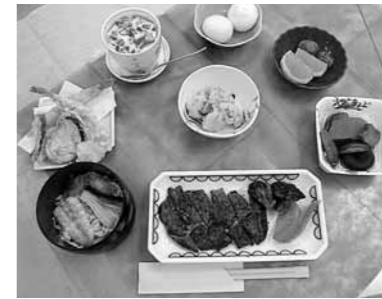
▲出産後のお祝い膳

出産後のお祝い膳や人間ドック受診後に提供するドック食に、ちらし寿司や季節のデザートを取り入れて食事を楽しんでいただけるよう、さらに工夫したメニューができました。