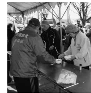
▲地域の皆さんによる炊き出し

沿道から温かいご声援を 今大会では、全国各地から多くのチームやその関係者が西脇市を訪れます。全国レベルの高校生の走りを間近で観戦できるまたとない機会です。ぜひ沿道に出て選手たちに温かいご声援をお願いします。 また、大会は多くのボランティアスタッフが運営し、スタート付近や中継点では物産展や炊き出しも予定されています。地域を挙げてこの大会を盛り上げ、「駅伝のまち」を全国にPRしましょう。