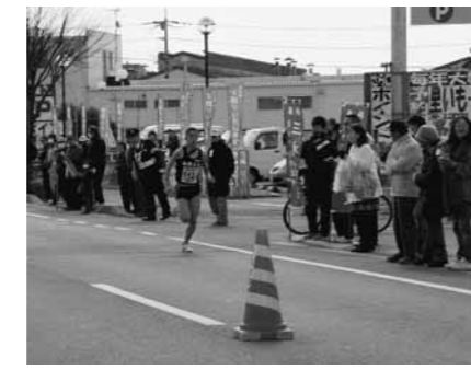
▲沿道からランナーを応援する市民

●大会コース図 コース及び迂回路 ①大会コースと交差する国道427号線(市原交差点付近)や主要幹線道路(小坂町交差点付近)などは、渋滞の恐れがあります。 ②コースに走者がいない場合は、警察官や警備員の指示に従って道路を横断してください。 ③競技の進行状況によっては、規制時間に変更があります。ご注意ください。