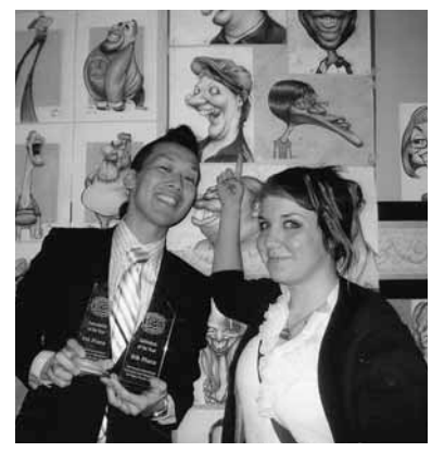
▲入賞したカリカチュア世界大会で描いたモデルと絵

「カリカチュア」は似顔絵とは違い、外観的特徴をとらえて内面性を誇張して表現し、その人らしい表情を描く風刺画のこと。就職して3年後「自分の絵で人を楽しませたい」という気持ちと大胆でメッセーじ性のあるカリカチュア独自のスタイルに魅了され、カリカチュアの会社に再就職することに。そして初出場したカリカチュア世界大会で総合9位に入り、その才能を認められ、店長を任せられました。「一生懸命に小さな目標を一つずつクリアしてきたからこそ、本当にやりたいことが見えてきた」と力が込められています。来月から故郷・西脇市に転居して独立を目指します。「地元のイベントにも参加してカリカチュアの楽しさを伝えていきたい。播州織ともコラボできたらいいですね」とさらなる挑戦に目を輝かせます。「いつかは雑誌の表紙を飾りたい」と夢を追い続けています。