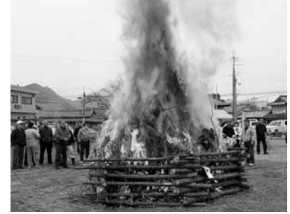
▲書き初め・ご家庭のしめ縄をご持参ください。