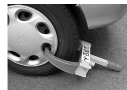
▲タイヤロックで固定して自動車を差し押さえます