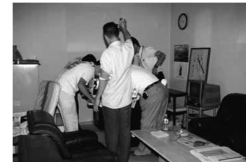
▲搜索を実施して動産等を差し押さえます