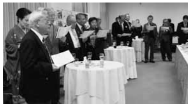
平成24年1月開催の懇親会の様子