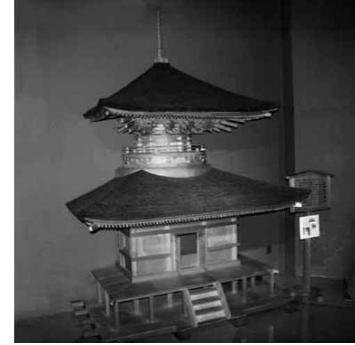
▲松皮茸の技法を引き継いだ息子さんが制作された黒田の荘厳寺多宝塔の模型(郷土資料館保管)

全国各所でたくさんのお思い出があります。有名なものでは京都の御所も手がけたとか。「住職と食事をしながら会話をするのも楽しかった」と笑顔で話します。海外にも出向き、1976年にはアメリカ建国200年を記念したファイラデルフィア市のフェアモントパークにある日本庭園の書院造りも改装。その時の記録もきれいに整理されており、見せてもらいました。