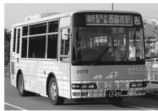
▲多可町コミュニティバス「のぎくバス」

西脇市と多可町は、国が進める「定住自立圏構想」に基づいて、さまざまな分野で連携して事業を進めています。