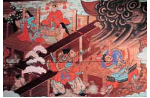
▲源頼政と猪早太の主従 (絵馬・鶴退治の図額)