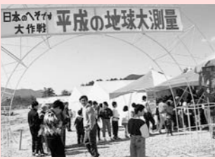
平成の大測量 日本へそ公園 大戦争