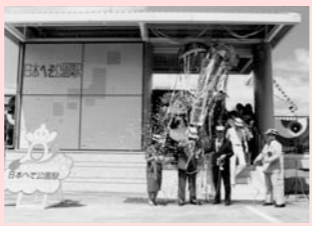
昭和60年 日本へそ公園駅開業