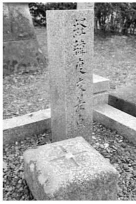
三角測量で求めた経緯度交差点

西脇市には、日本の中心にあたる東経135度と北緯35度の交差点があり、私たちはこれを「日本のへそ」と呼んで親しんでいます。西脇市が全国に向けて「日本のへそ」を宣言したのは昭和52年、今年で35周年を迎えます。今では「へそ」は単に地理的な中心ではなく、ふるさとのシンボルとして、また、まちづくりの原点として西脇市民の心に根づいています。このユニークなキャッチフレーズがどのように生まれ育まれてきたか、35周年を契機に「日本のへそ」をも一度見直してみよう。