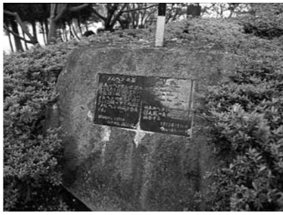
世界各地の名所にあるメルヘン石 三角測量で求めた経緯度交差点