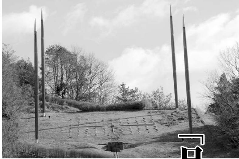
GPS測量で求めた交点に建設した日本のへそモニュメント

ひそかなお国自慢が今ではふるさとのシンボルに。「へそ」は西脇市のまちづくりの原点なのです。