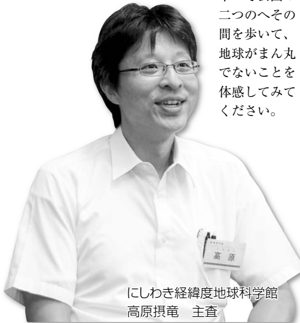
にしわき経緯度地球科学館 高原 撰 主査

地球って意外に丸くないんですよ。実際に日本へそ公園の二つのへその間を歩いて、地球がまん丸でないことを体感してみてください。