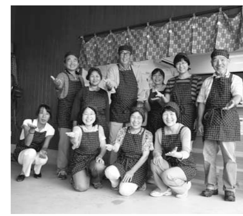
北はりま農産物直売所「旬菜館」で 毎週土日オープン 旬菜家族