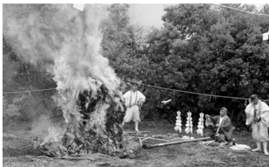
▲昨年の岡の山まつり