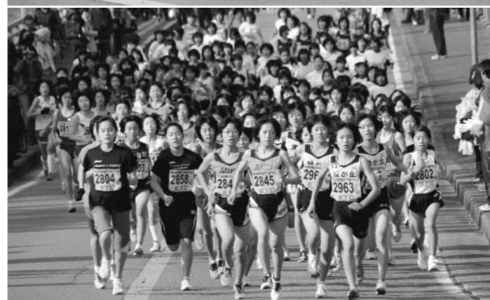
女子中学生の部 スタート直後の先頭争い