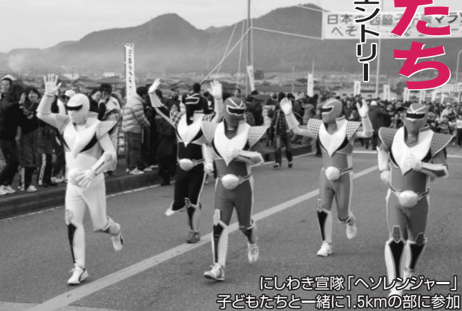
にしわき宣隊「ヘソランジャー」子どもたちと一緒に1.5kmの部に参加