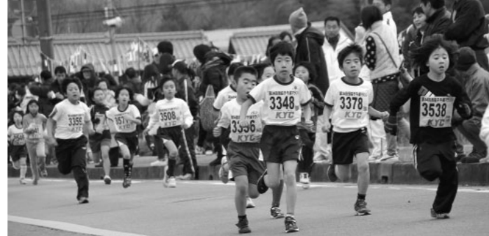
子どもたちの元気いっぱいの走り

特定健康診査の結果で異常が見つかったら 健診で生活習慣病の危険性が高いと判定された方は、無料で特定保健指導を受けることができます。 問合せ 市民課保険担当 (市役所内線371)