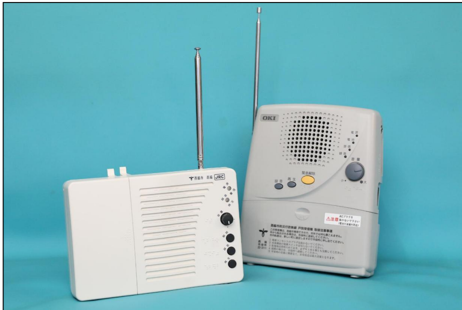
左：デジタル方式の戸別受信機 右：旧のアナログ方式の戸別受信機