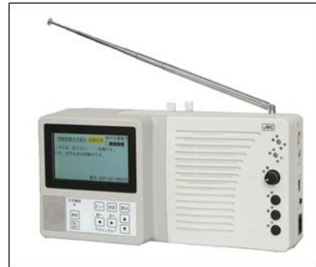
モニター付きの戸別受信機