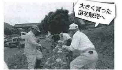
大きく育った苗を販売へ