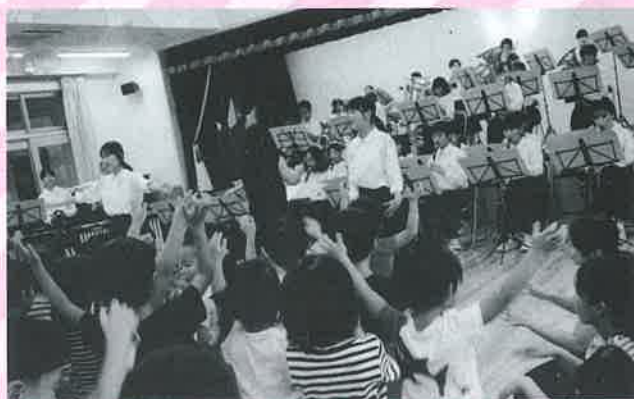
「パプリカ」をいっしょに踊りましょ

最後に、すみれ組さんが代表で「ありがとうの花」を歌って、花の折り紙を吹奏楽部のお兄さん・お姉さんに手渡しました。