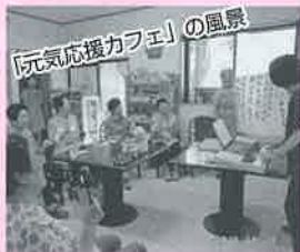
「元気応援カフェ」の風景