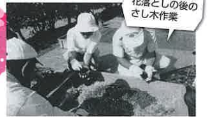
花落し後のさし木作業

現在の活動人数は約20人。今後もあじさいを増やし、あじさいクラブの活動維持のために私たちと一緒にやってみませんか？