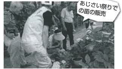
あじさい祭りでの苗の販売