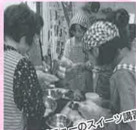
メニューのスイーツ講習