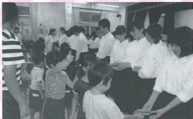
心をこめてお手紙を書いたよ