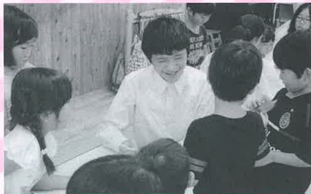
いっしょに折り紙しようね！