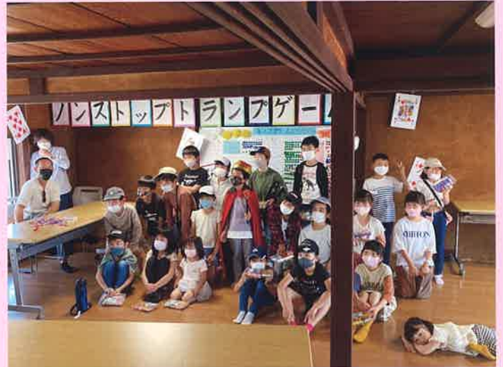
パパめきは、年齢関係なく楽しめました