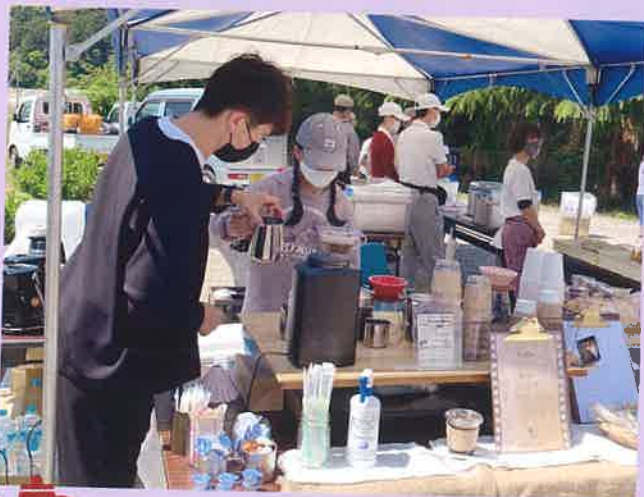
コーヒーの淹れ方を教わりました