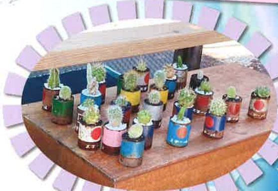
可愛いハンドメイドの作品