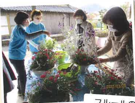
春の寄せ植え (3月20日)

ウクライナ募金 33,453円 集まりました。 市役所を通じて、日本赤十字社に送金しました。