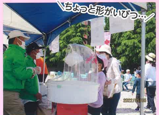
自治協のわたがし