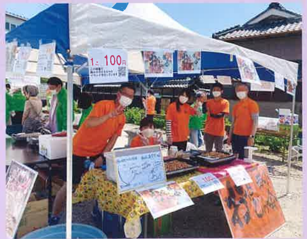
西小おやじの会の皆さん