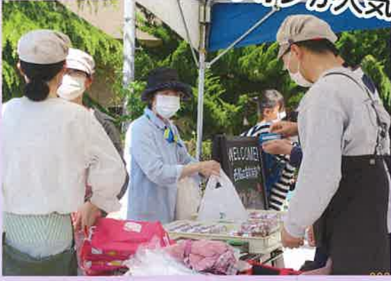
西脇工業高校家庭部