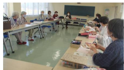
2019年 先生が不在でも来られるのを、毎回教室で待っていました。本当にありがとうございました。