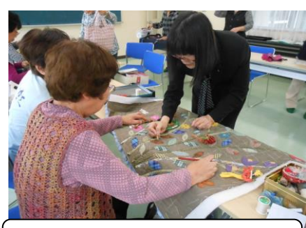
2015年 生徒さん順番待ち♡