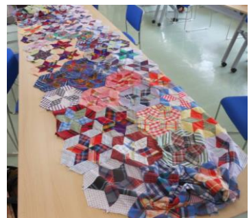
提出された布を縫い合わせ、大きくしていきます。