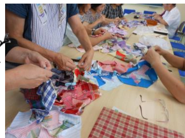
2016年北校緞帳 小さなパーツを縫い合わせ。参加された方もあるのではないのでしょうか。