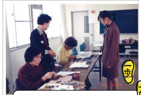
1999年9月 この年に教室が始まりました。

2021年2月に、約20年間続いたパッチワーク教室が、先生の訃報でおしまいすることとなりました。その様子をたどってみました。