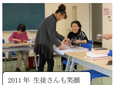
2011年 生徒さんも笑顔