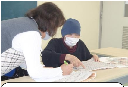
2020年9月 お休みされていた先生が来られ、みんな先生のもとへ♡

2021年2月に、約20年間続いたパッチワーク教室が、先生の訃報でおしまいすることとなりました。その様子をたどってみました。