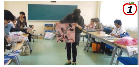
2012年カルチャー体育館で展示会が行われました。講座生の作品もつなぎ合わせて右下の作品になりました。