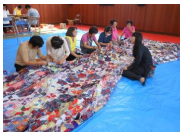
2017年北校緞帳 一般参加の方々と一緒に、 講座生も西脇北高校に通いました。