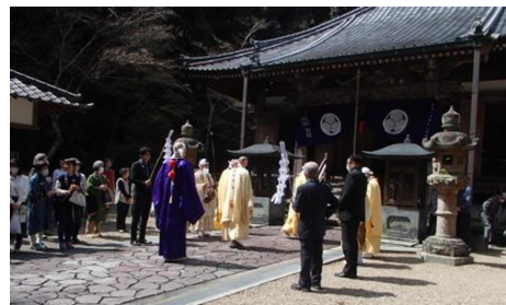
参道を通り、本堂にてご法楽