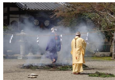
ご祈祷の後、住職はじめ一般の方も火渡り修行をされました。