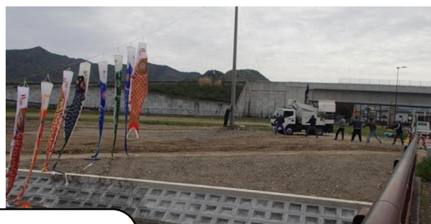
4月18日(土)天神池と、道の駅に区長会の皆さんと、自治協の皆さんで鯉のぼりが掲揚されました。ぜひご覧ください。