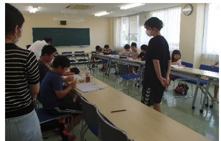
みなみ会主催【宿題教室】も大盛況！