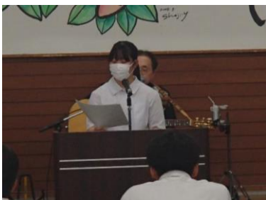
中学生人権作文朗読