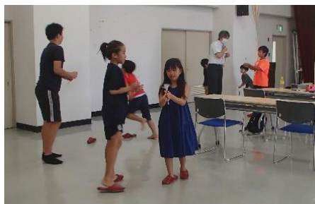
スーパーボールロケット