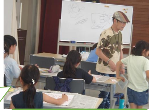
【絵画教室】構図を考え中！