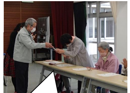
「修了証書」授与 また来年度もよろしく!