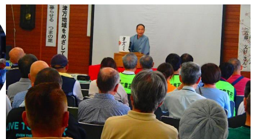
講演会では落語の披露