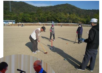
グラウンド ゴルフ大会