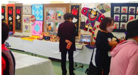
講座生作品展示 詳しくは、大野隣保館ホームページにも掲載しておりますので、そちらも併せてご覧ください。