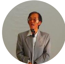
運営委員長あいさつ