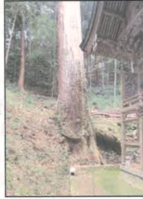
胸高幹周5.5mの杉のご神木

※岩の崖: 春日神社の南西にある岩板で、加古川の水が岩を侵食して削り取り、崖のようになったもの。