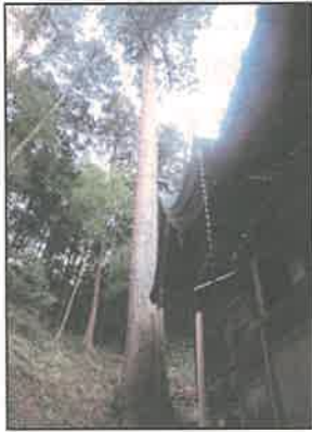
杉のご神木・全景

なお、裏山全体は杉の人工林ですが、近くに樹齢150年を超えた杉の切株が2つあります。また、尾根には、植林時の伐採を免れたシイノキの大木が多く植わっています。