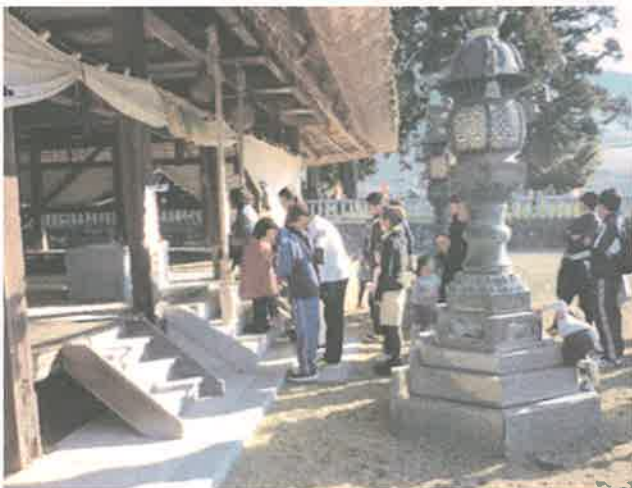
兵主神社にて、新年のお参り