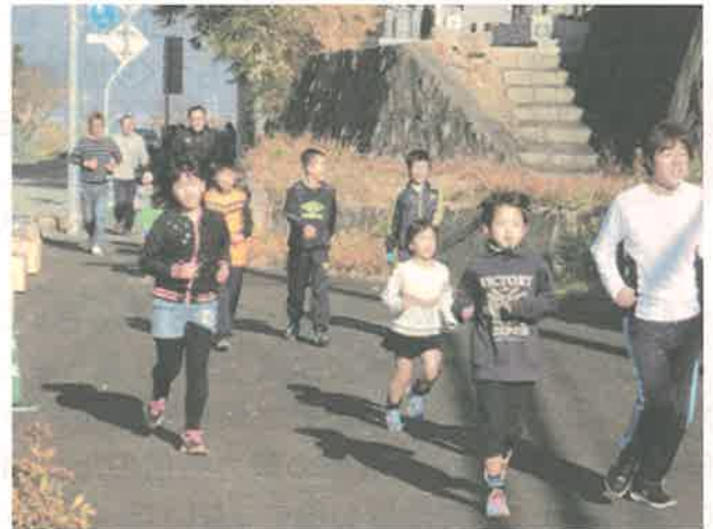
黒田庄グラウンド⇄兵主神社往復3キロ