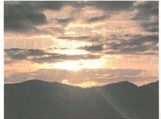
雲の隙間から拝めた初日の出！