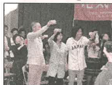
1位指名を祝って乾杯