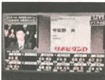
ソフトバンク1位指名！