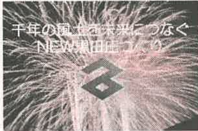
フェイスブック・カバー画像

「黒田庄まちづくり協議会」とネット検索して頂ければ、「黒田庄まちづくり協議会・Home | Facebook」が表示されますので、開いてみてください。また、西脇市役所ホームページからもアクセスできます。西脇市役所ホームページ画面右側に「まちづくり」とありますので、開いて頂くと各自治区が表示されます。そして「黒田庄地区」を開いて頂き、「黒田庄地区のフェイスブックページ」とありますのでアクセスしてみてください。