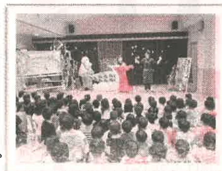
<園の七夕集会の様子>

十分なことはできないかもしれませんが、ローカルで、グローバルな子どもの育成をめざして、「共育ち」を大切に、地域と繋がっていきたくて思っております。今後ともよろしくお願ひします。