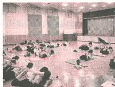
親子インドヨガ体験教室