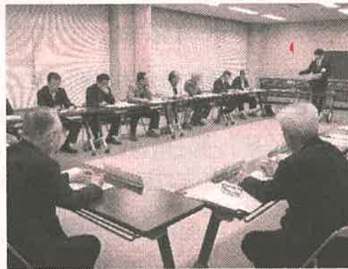
平成30年度黒田庄地区区長会総会