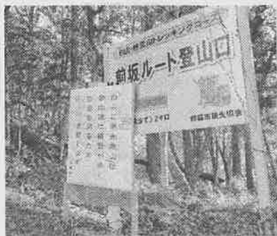
中止の看板を設置

参加された老若男女に、野外活動協会から毎年ご来光登山記念の品をお渡しするのですが、今年は疫病退散「アマビエ」のカードを準備していましたが、有効利用ということで町内の学童の塗り絵カードとして某にお渡ししました。