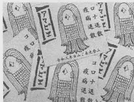
疫病退散「アマビエ」カード