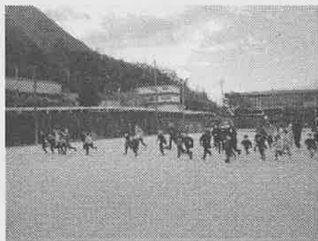
黒田庄グラウンドをスタート