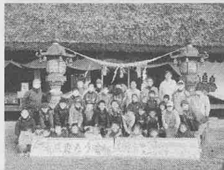
兵主神社で記念撮影