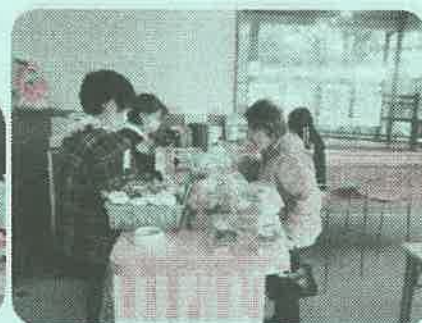
「あつまっ亭チャレンジショップ」出店の様子