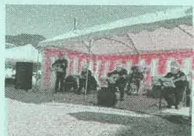
ゴールデンギャップスによるバンド演奏 (地域交流部会)