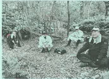
昨年の登山道整備の様子