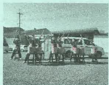
虹の会工房による樽太鼓