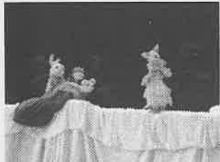
おやゆび姫さんによる人形劇