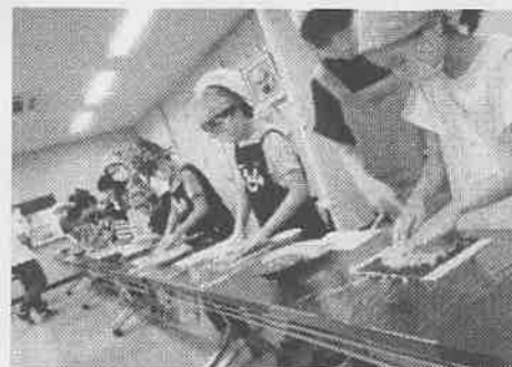
親子で巻き寿司体験

当日の「自然環境学習コース」のアンケート調査では、「川遊び、とても良いです。」「いろんな魚に会えて楽しかった。」「巻き寿司は初めての体験でも楽しかったです。」「地域の方々の説明が丁寧で熱心で良かった。」といった感想がありました。