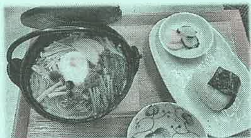
鍋焼きうどんセット

農家レストラン日時計はもうすぐ5周年を迎えます。日頃のご愛顧ありがとうございます。この度、寒い冬場の限定メニューやうどんメニューを充実しました。