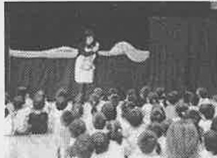
エプロンシアター