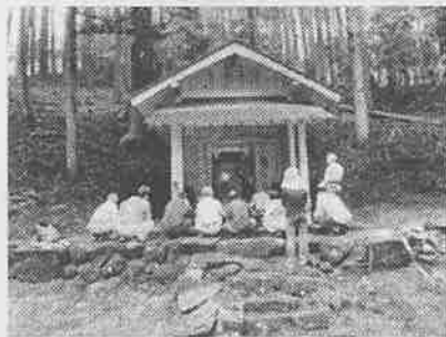
妙見堂を前に参拝隊でお神酒を頂く

妙見堂は、その名の通り妙見菩薩を祀るお堂です。妙見菩薩は北極星を神格化した菩薩です。北極星は、天体の中で唯一沈まない星、常に光り輝いている星ですから、妙見菩薩は、『常に国を災いから守り、人々の健康(=寿命を延ばす)へ導く福德ある菩薩』とされています。