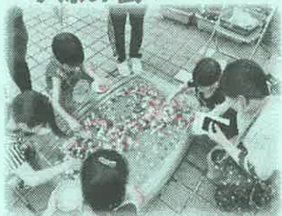
<うまくすすめるかな??ボールすくい>

保護者役員会と職員の企画・運営による「夕涼み会」が、去る7月20日(土)に、黒っこプラザをお借りして開催されました。この「夕涼み会」は、これまで、「七夕会」として長らく続けられていたのですが、天候を心配したり、場所を心配したりと...いろいろあり、会の名前や日程を変更して開催いたしました。(黒っこプラザには、大変お世話になりました。)