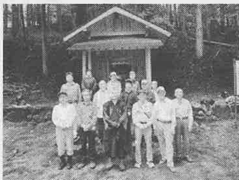
妙見堂の前で集合写真