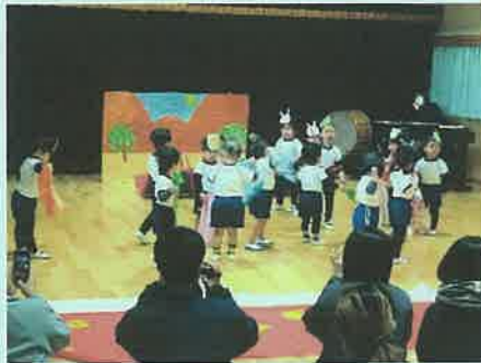
「もりのおふとん」(2歳児)