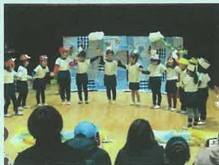
「からすのパンやさん」(4歳児)