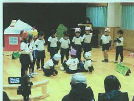
みんなのベロニカ」(4歳児)