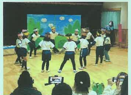
「らいおんのめがね」(5歳児)