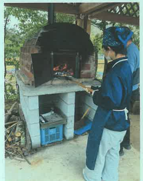
石窯でピザを焼く