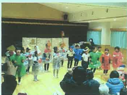
「かさじぞうプラスさるじぞう」(5歳児)

この1年間、黒田庄こども園の諸活動に深いご理解とご支援をいただき、ありがとうございました。