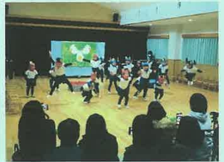
「ぐりとぐらとくるりくら」(3歳児)