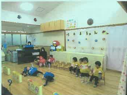
「だるまちゃんが…」(1歳児)