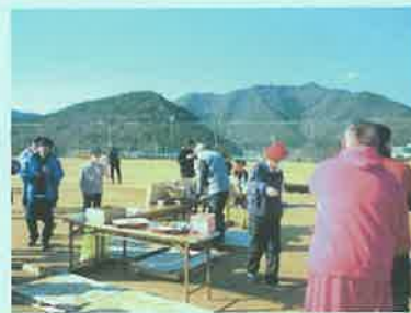
黒田庄グラウンドでぜんざいの振る舞い等