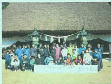
兵主神社で記念撮影