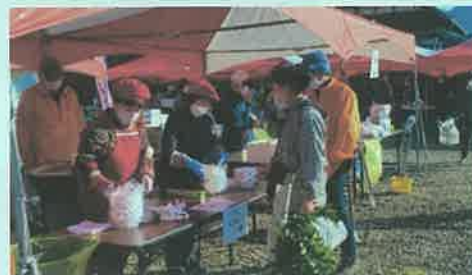
第11回黒田庄軽トラ市(歳末市)

編集・発行 黒田庄まちづくり協議会 西脇市黒田庄町前坂2140番地 TEL 28-2121 令和5年1月15日発行