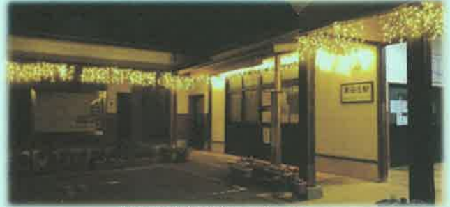
黒田庄駅舎「あつまっ亭」