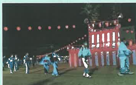
第43回にしわき市・黒田庄夏まつり