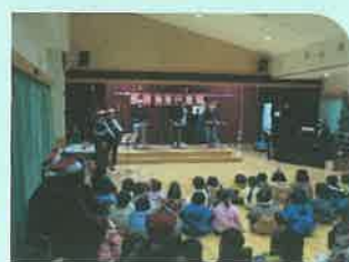
「サンタが街にやってくる」