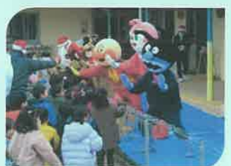
サンタさんたちとハイタッチ!