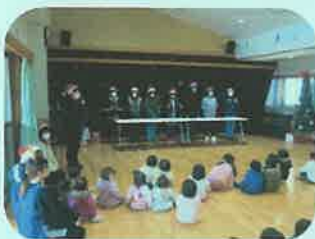
ハンドベルの演奏

今年も、サンタさんとトナカイさん、それに、アンパンマンやバイキンマン、ドキンちゃん、にしー、さくらちゃん、黒田牛兵衛と、たくさんのキャラクターが駆けつけてくれました。一緒に踊ったり、サンタさんに質問をしたりしました。最後は記念撮影でハイチーズ。