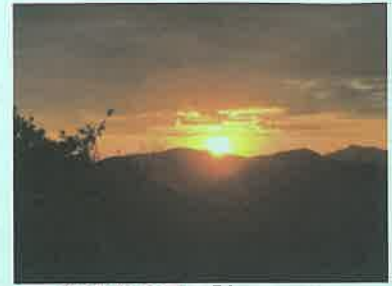
白山から見る「初日の出」

今回はいつもの年より少し暖かいご来光登山でした。皆さん、登山途中から空には雲が覆いはじめ、ご来光を拝めるか心配しながらの登山でした。やっと着いた頂上では少しずつ雲間に照らされ夜が明けてくる気配ができて「雲が切れますように…」と祈りつつ、遠くに見渡せる周りの山々を眺め、静寂の麓から聞こえてくる微かな除夜の鐘を聞きながら、令和5年の初日の出が見えるのを待ち受けました。