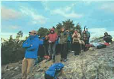
初日の出に祈念する参加者

日の出予想時間の午前7時8分をまわり、いよいよ標高712.9mの西光寺山の上から昇るご来光の瞬間、参加者それぞれ合掌し「令和5年が良き年でありますように」…と初日の出に祈念しました。