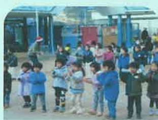
みんなでクリスマス・ダンス!