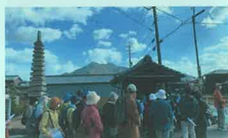
黒田庄歴史ハイキング