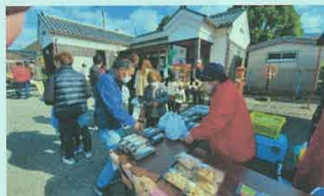
あつまっ亭感謝祭