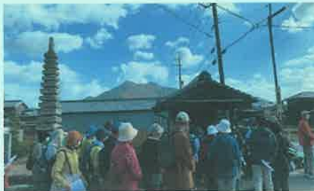
大門 十三重の石塔・地藏堂