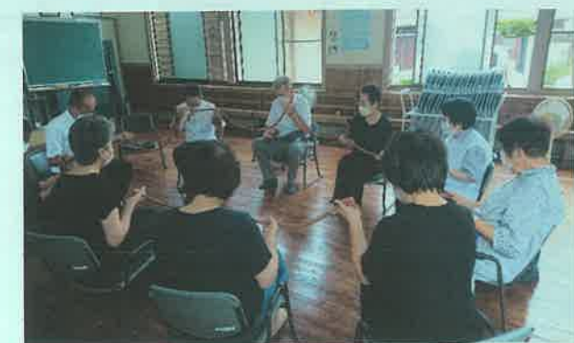
数珠送り(般若心経三回)