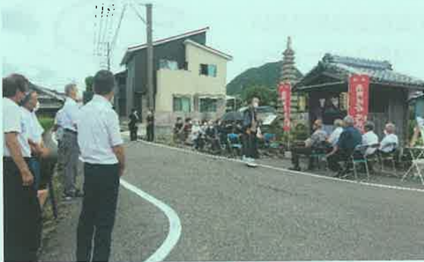
東光寺住職の読経

その後、役員のみで数珠送りや後片付けを行い、子どもたちにはお供えのお菓子を子ども会会長から分配してもらいました。来年こそ、役員一同、元気な子どもたちの笑顔が見られるようお願いながら解散しました。